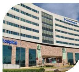
Hospital Vithas Sevilla- Aljarafe