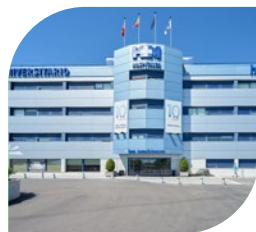
Hospital Madrid Norte Sanchinarro