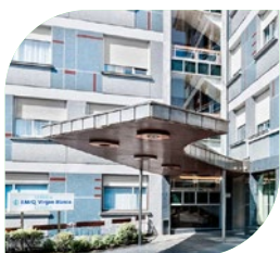
Clínica Virgen Blanca