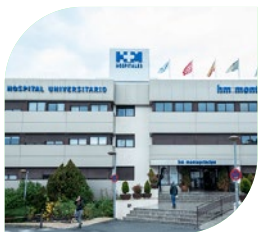
Hospital Madrid Montepríncipe

Cigna pone a su disposición una de las redes de servicios médicos concertados más prestigiosa y extensa, con más de 49.650 especialistas y 1.942 hospitales, centros médicos y clínicas privadas en España.