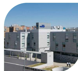
Hospital Viamed Santa Ángela de la Cruz