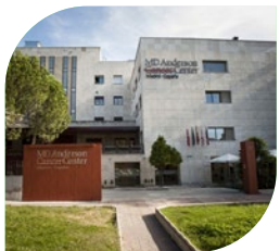
Hospital MD Anderson