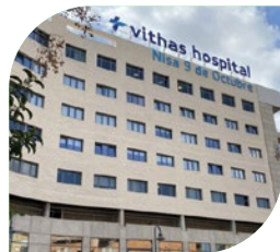
Hospital 9 de Octubre