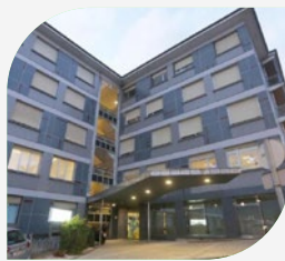
Clínica Virgen Blanca