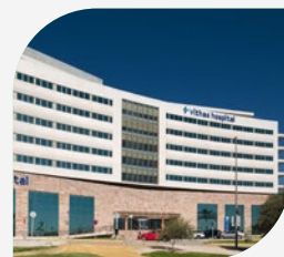
Hospital Vithas Sevilla-Aljarafe