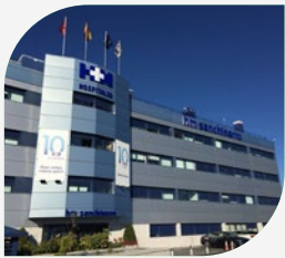
Hospital Madrid Norte Sanchinarro