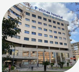
Hospital 9 de Octubre