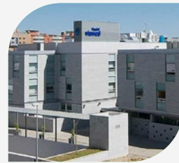
Hospital Viamed Santa Ángela de la Cruz