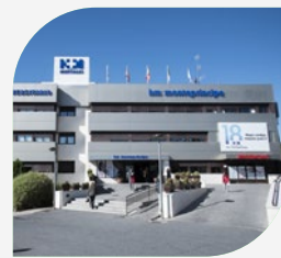
Hospital Madrid Montepríncipe