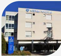
Hospital Vithas Pardo de Aravaca